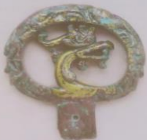
単鳳環頭大刀柄頭 (たんほうかんとうたちつかがしら)