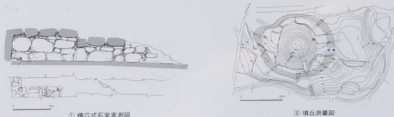
① 横穴式石室実測図

During an excavation in 1901, burial items such as gems, weaponry, and horseback riding gear were discovered. Many of them have been stored in the Tokyo National Museum with some stored in Kibi Temple.