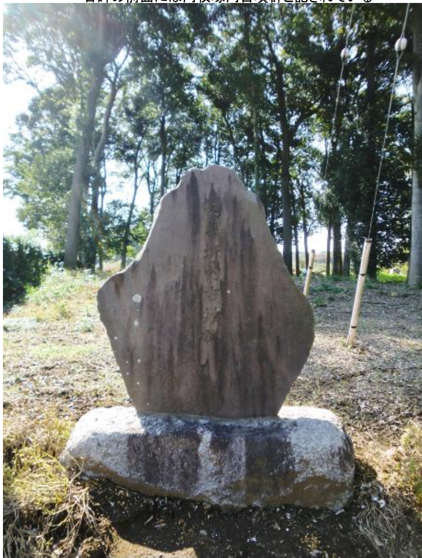
石碑の前面には内牧塚内古墳群と記されている