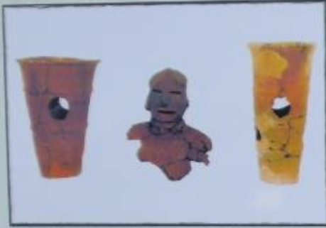
武蔵型円筒埴輪、武人埴輪、下総型円筒埴輪