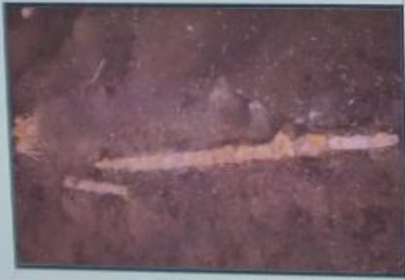
お墓から鉄剣が発見された様子