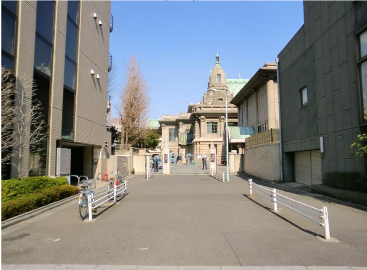
敷地の右側のアプローチより