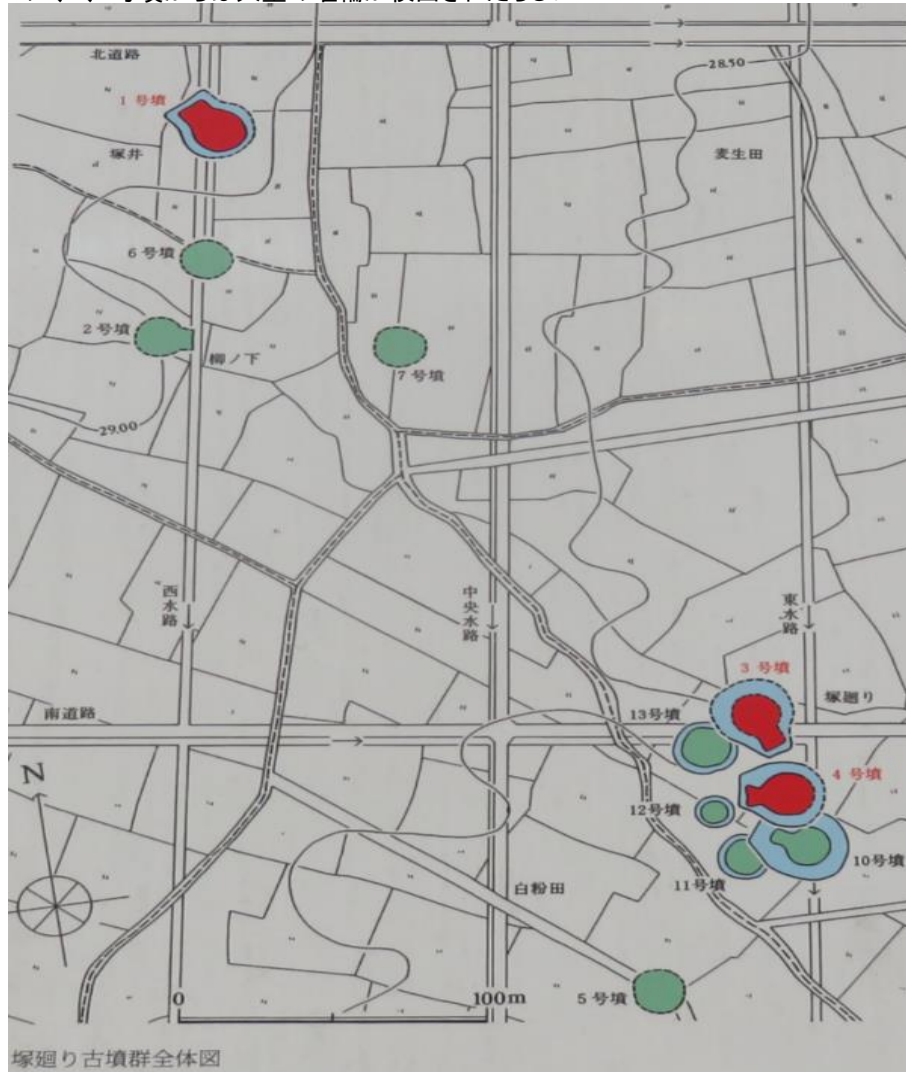
塚廻り古墳群全体図

塚廻り古墳群の全体図/このエリアから11基の古墳が発掘されているようだ/赤色の1、3、4号墳からは大量の埴輪が検出されたい