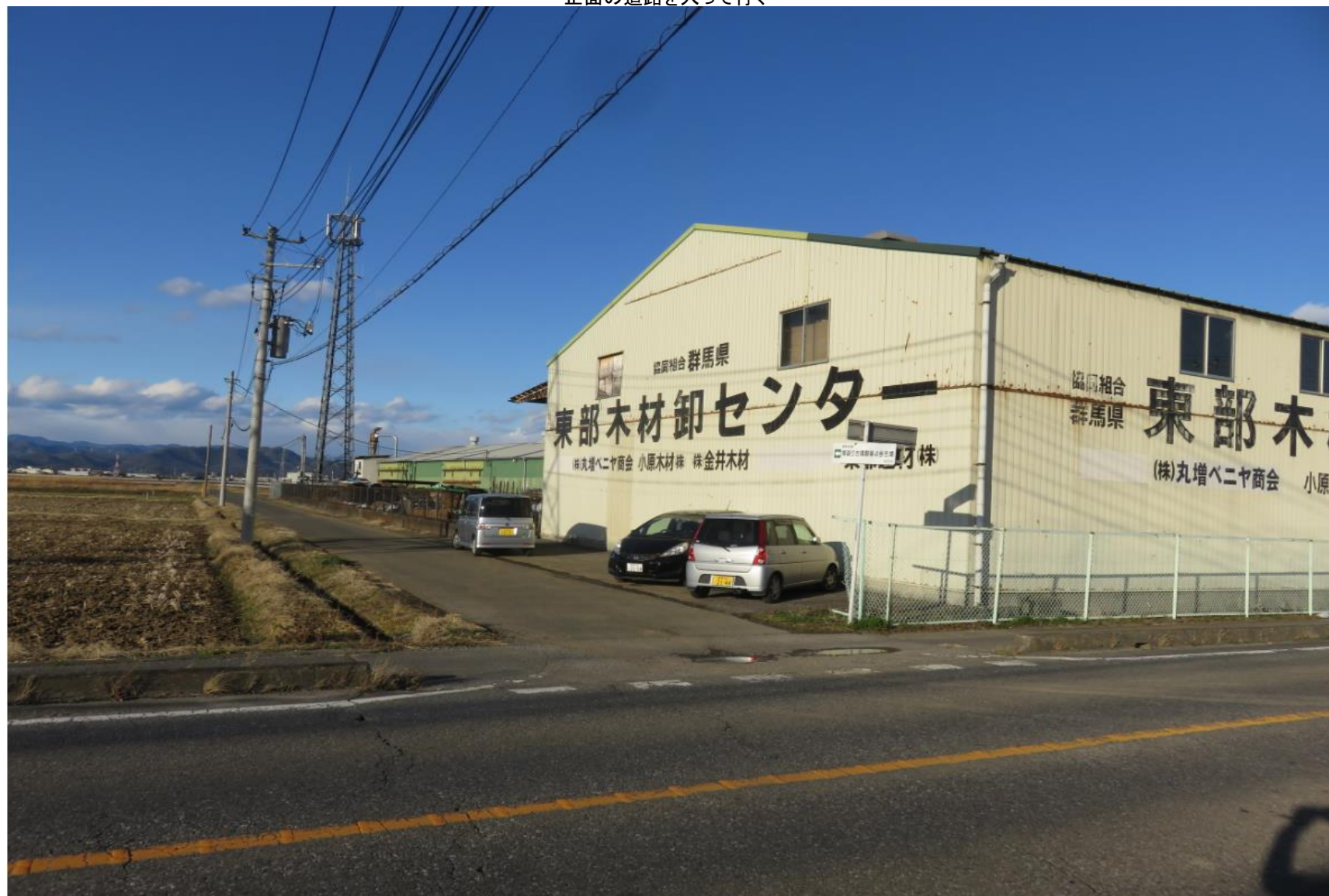
正面の道路を入って行く