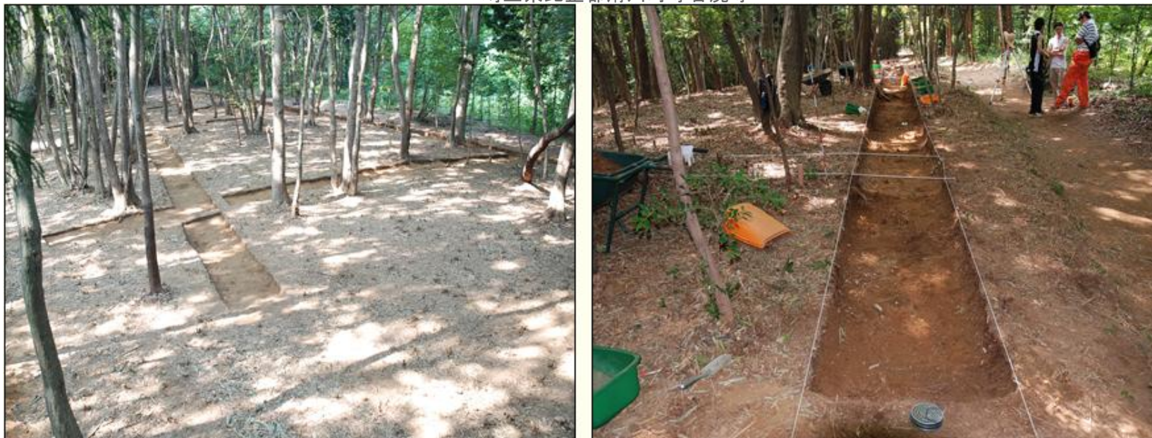
(インターネットより借用)