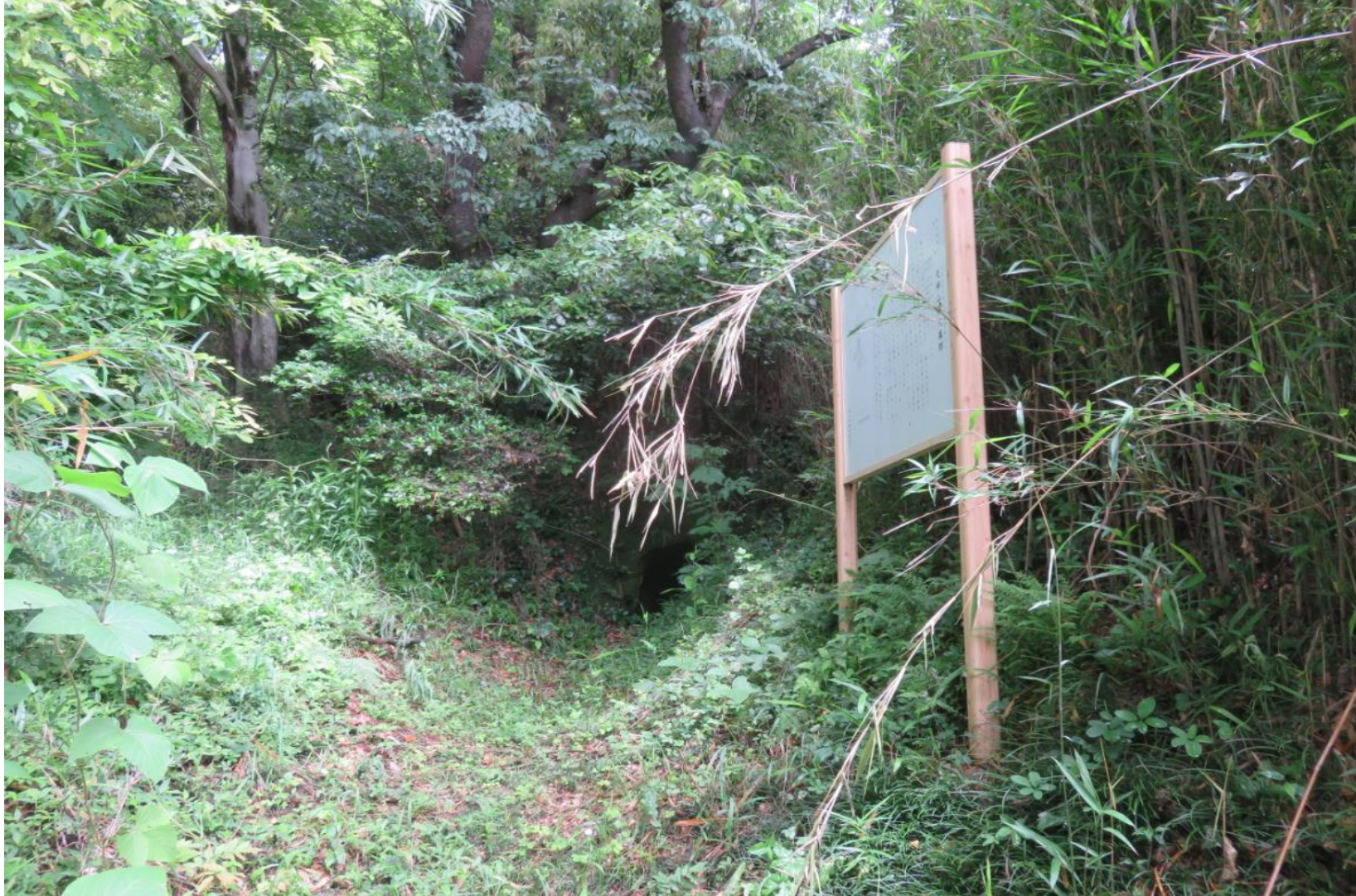
藪の中に踏み込むと、説明板が立っている/前方に横穴墓が開口している