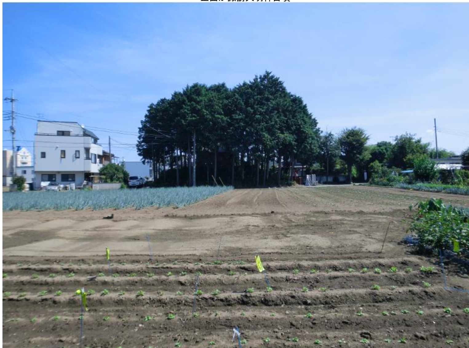
正面が諏訪大明神古墳