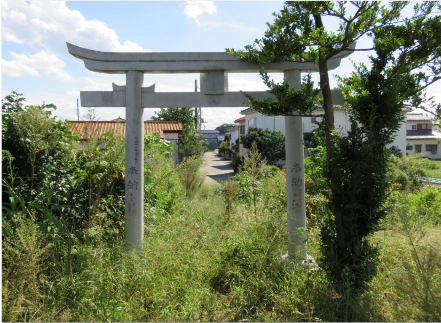
振り返って見たところ