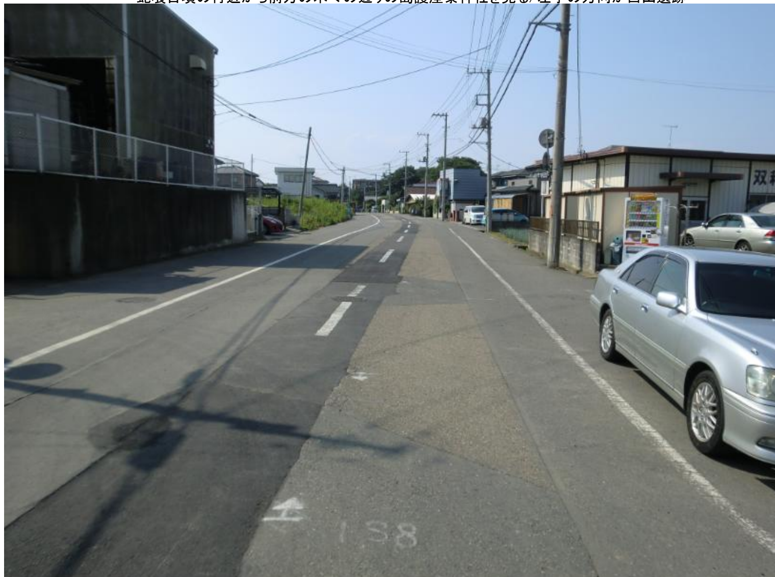
蛇喰古墳の付近から前方の木々の辺りの島護産泰神社を見る/左手の方向が白山遺跡