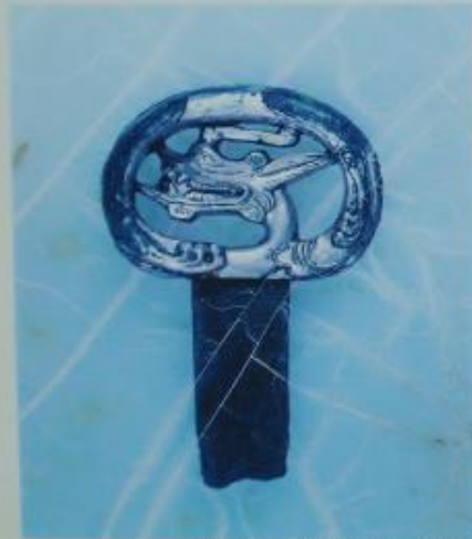
皇子塚古墳出土遺物