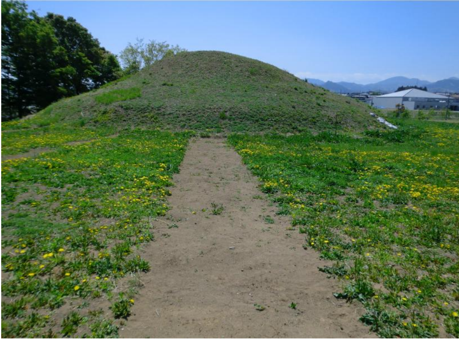
北側から見たところ