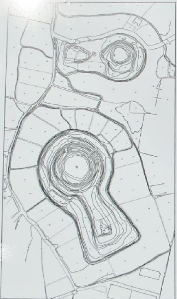
大鶴巻古墳及び小鶴巻古墳墳丘

この古墳は、鳥川左岸の段丘上に築かれた全長三三mの前方後円墳で平坦地に土を二段に盛り上げてつくられています。ただし、後円部の墳頂下五mのあたりで等高線の間隔がゆるやかな部分が見られることから三段築成の可能性もあります。後円部の径が七m、高さ十五mであるのに対し、前方部の長さ五m、前端幅五四m、高さ六・五mと、後円部に比較して前方部の幅が狭く、未発達という特徴を持っています。墳丘のまわりには楕型の周堀をめぐらし、地割りにその痕跡が残るなどよく原形をとどめています。墳丘の表面には埴輪片や葺石として用いられた川原石が認められます。主体部は明らかにされていませんが、竪穴系の埋葬施設があったと考えられ、墳丘・周堀りの形状や採集された埴輪の特徴から四世紀末から五世紀初頭にかけてつくられたことが推測されます。