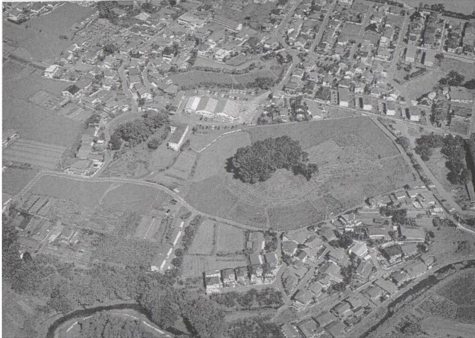
大鶴巻古墳（右）・小鶴巻古墳（左）を南上空より望む

大東文化大学オープンカレッジ/平成26年春期講座/シリーズ講座 郷土の歴史を学ぼう/フィールドスタディー-式内社と博物館の踏破及び見学- 資料より