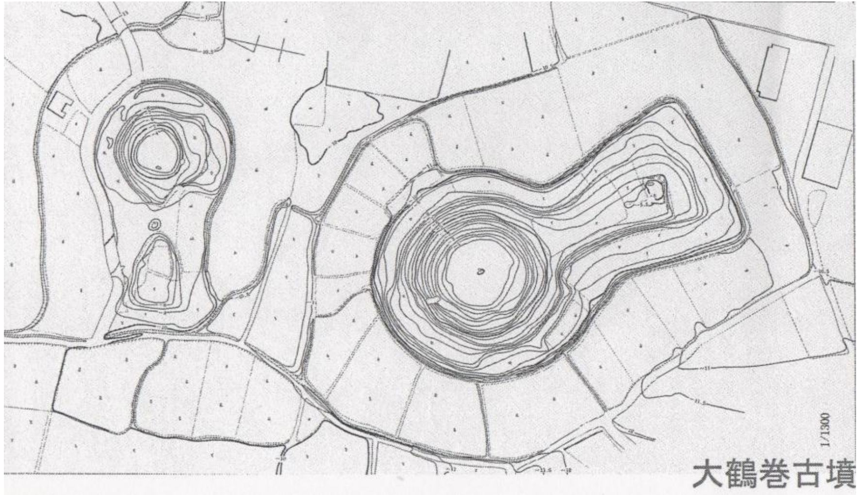
大東文化大学オープンカレッジ/平成26年春期講座/シリーズ講座 郷土の歴史を学ぼう/フィールドスタディー-式内社と博物館の踏破及び見学- 資料より