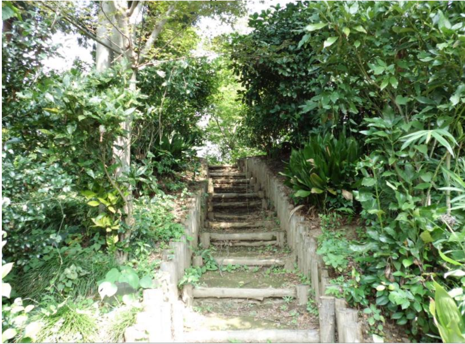
墳丘に登ってみる