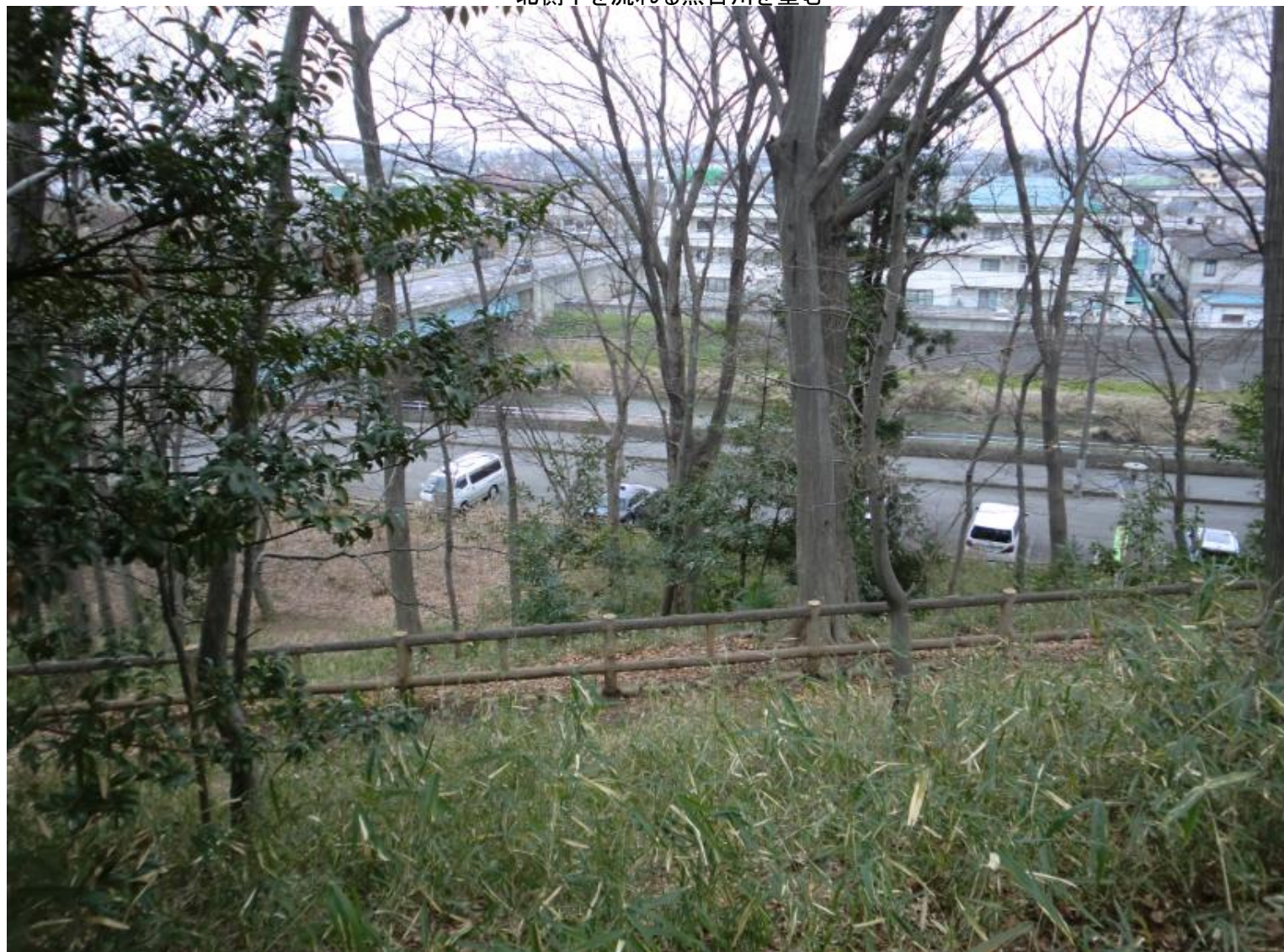
北側下を流れる黒目川を望む