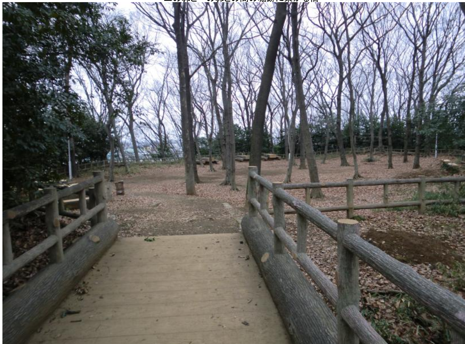
二の郭と一の郭との間の堀跡に架かる橋