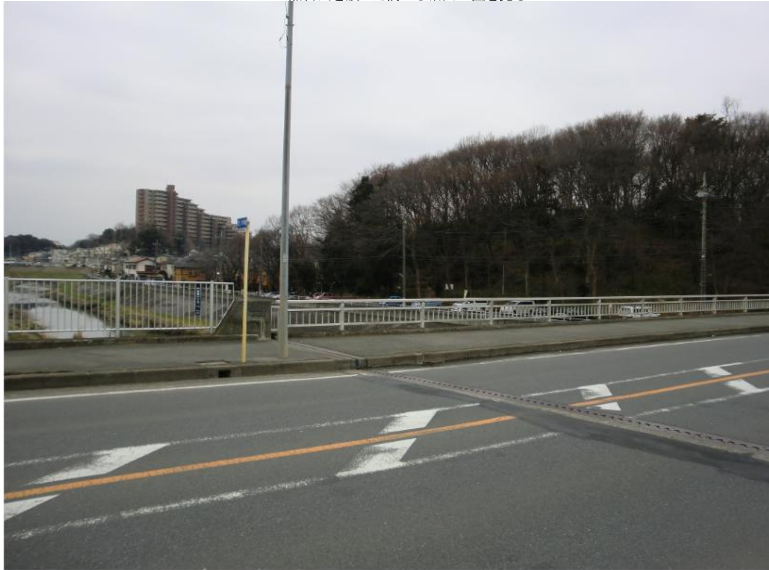
黒目川を渡った橋から城山公園を見る