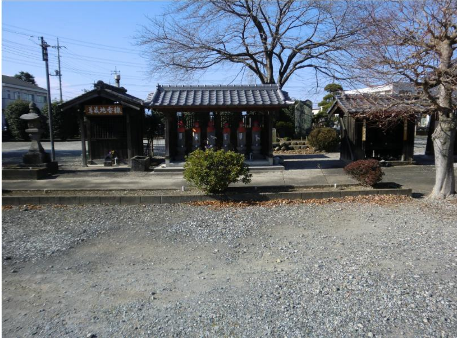
左手のさまざまな石造物群