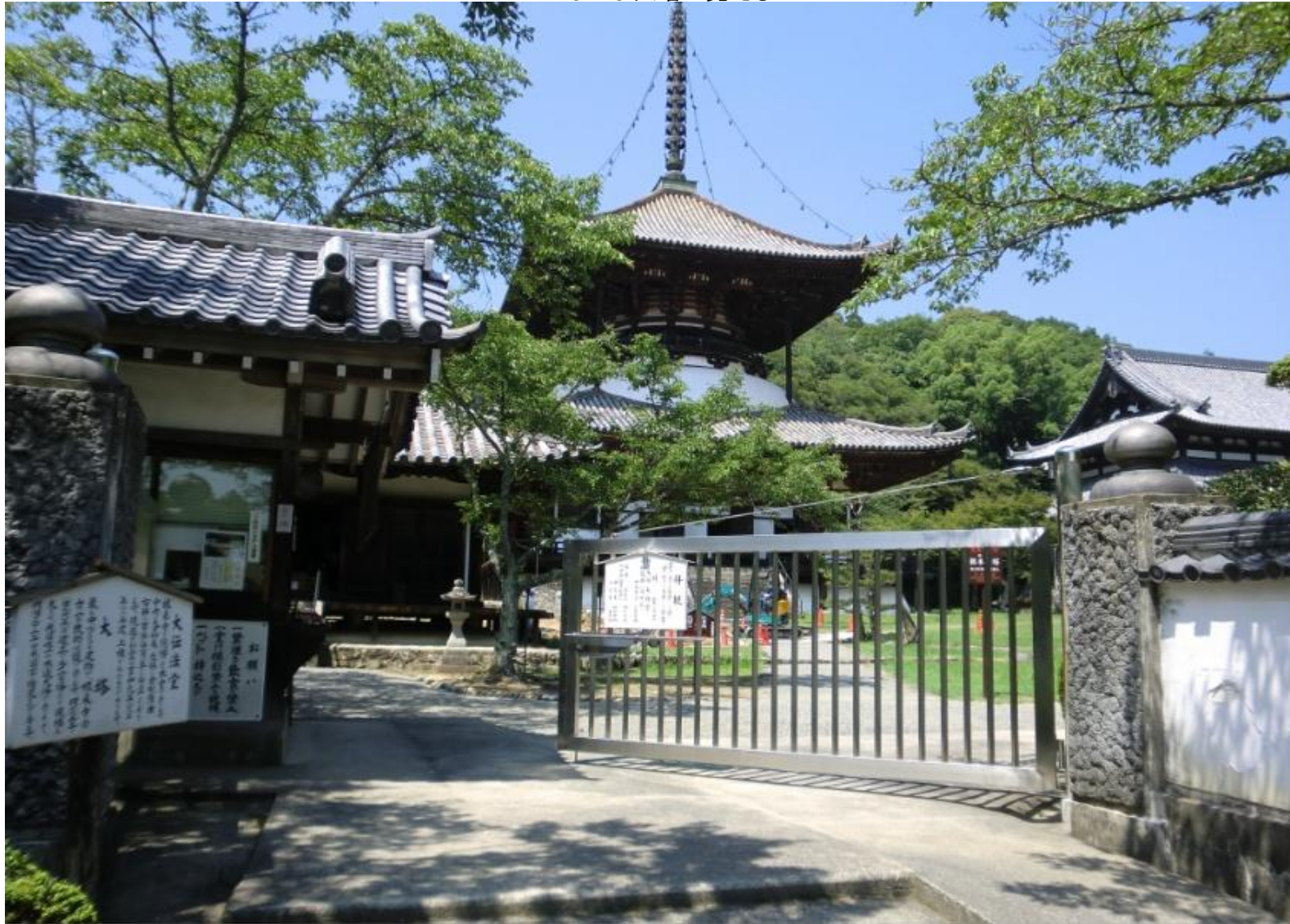
いよいよ大塔が見える