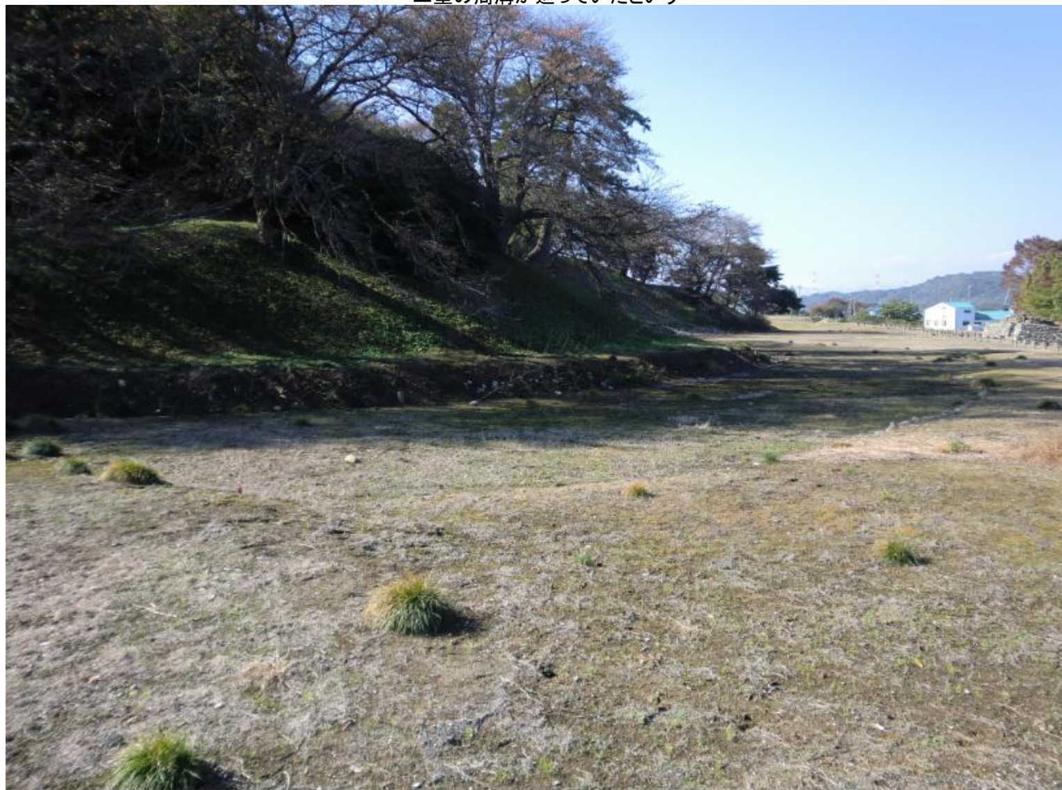
二重の周溝が巡っていたという