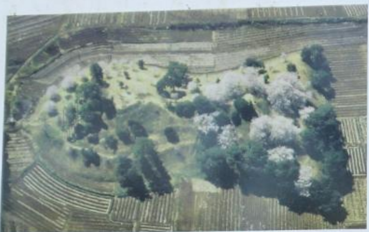
七輿山古墳航空写真