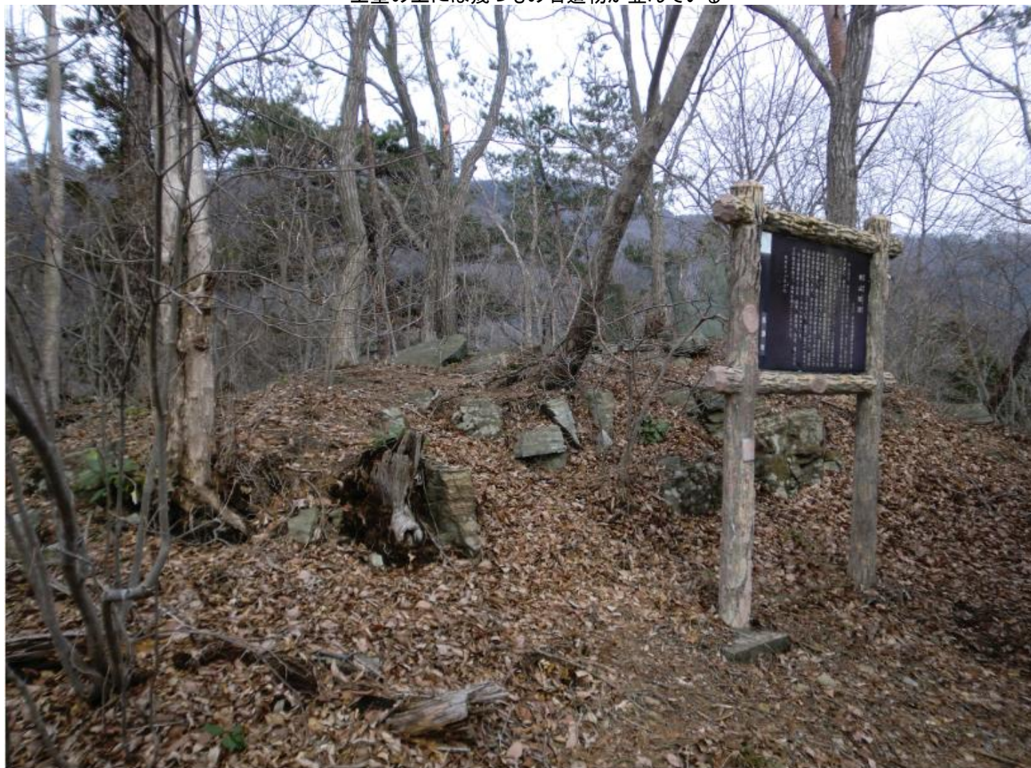
土塁の上には幾つもの石造物が並んでいる