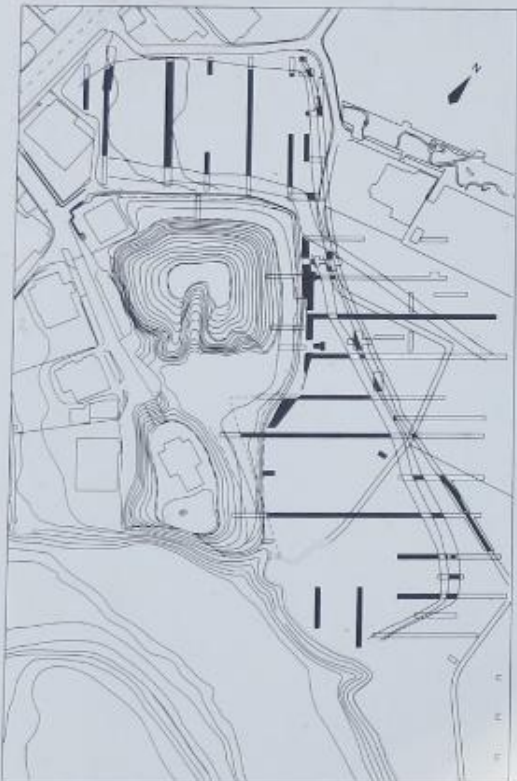
将軍塚古墳全体図

この古墳は、墳丘の構造・副葬品・出土した土器類などから四世紀後半に築造されたと推定されており、井野川流域で初めてつくられた大型の前方後方墳である。