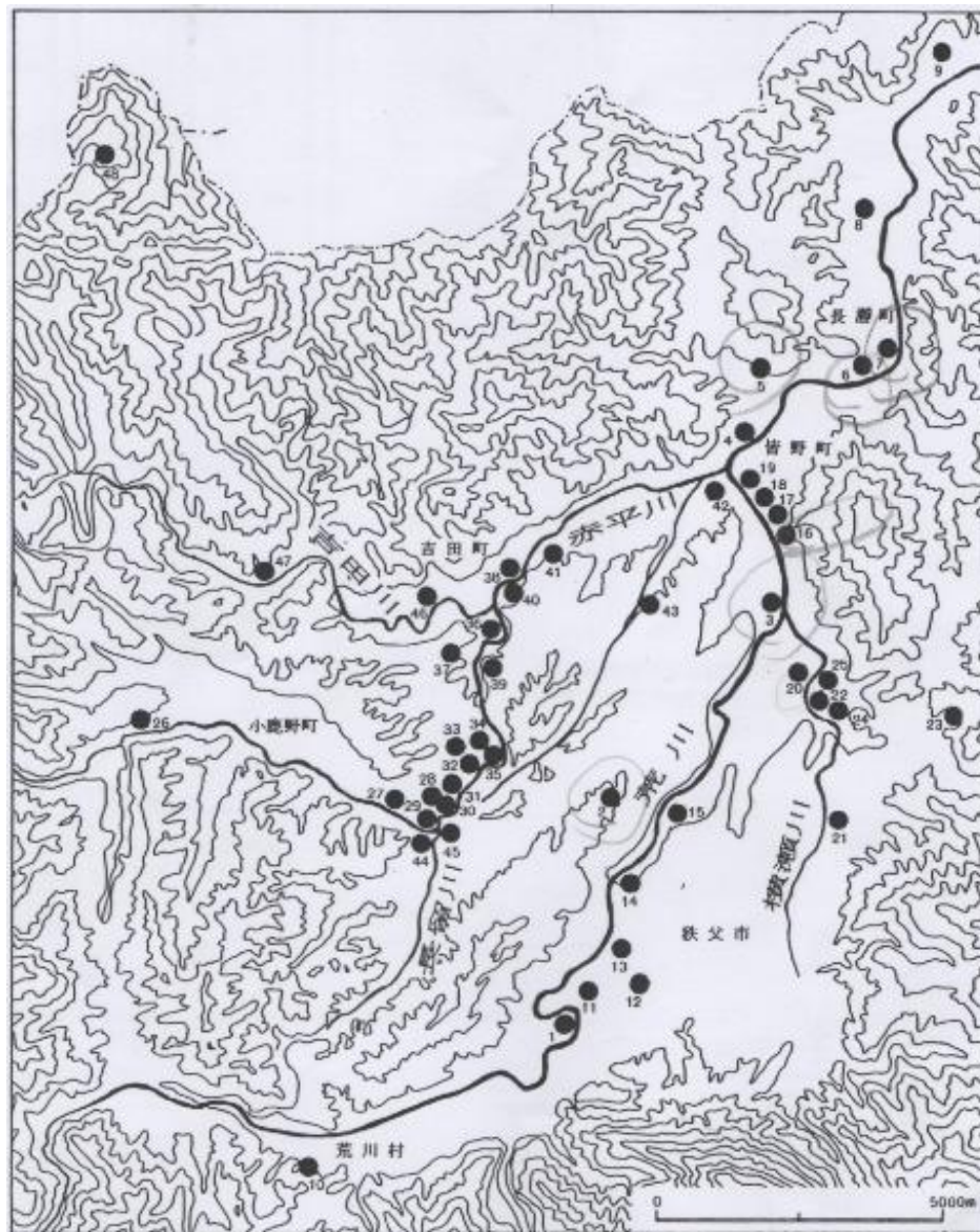
図1 秩父地方の古墳群分布図