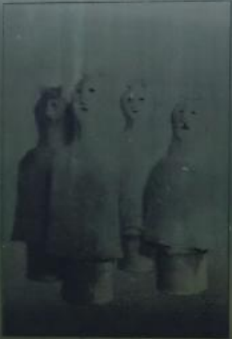
おくま山古墳出土埴輪