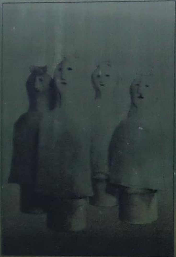
おくま山古墳出土埴輪