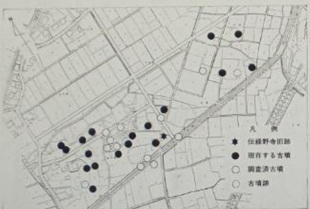
伝緑野寺旧跡と城戸野古墳群 縮尺1:2000

伝緑野寺旧跡の周囲に点在する小丘は、今から一三〇〇年程前に造られた古墳で、これらは「城戸野古墳群」と呼ばれる。古墳群は、町内で最も南に所在し、その総数は三十基余り確認されている。