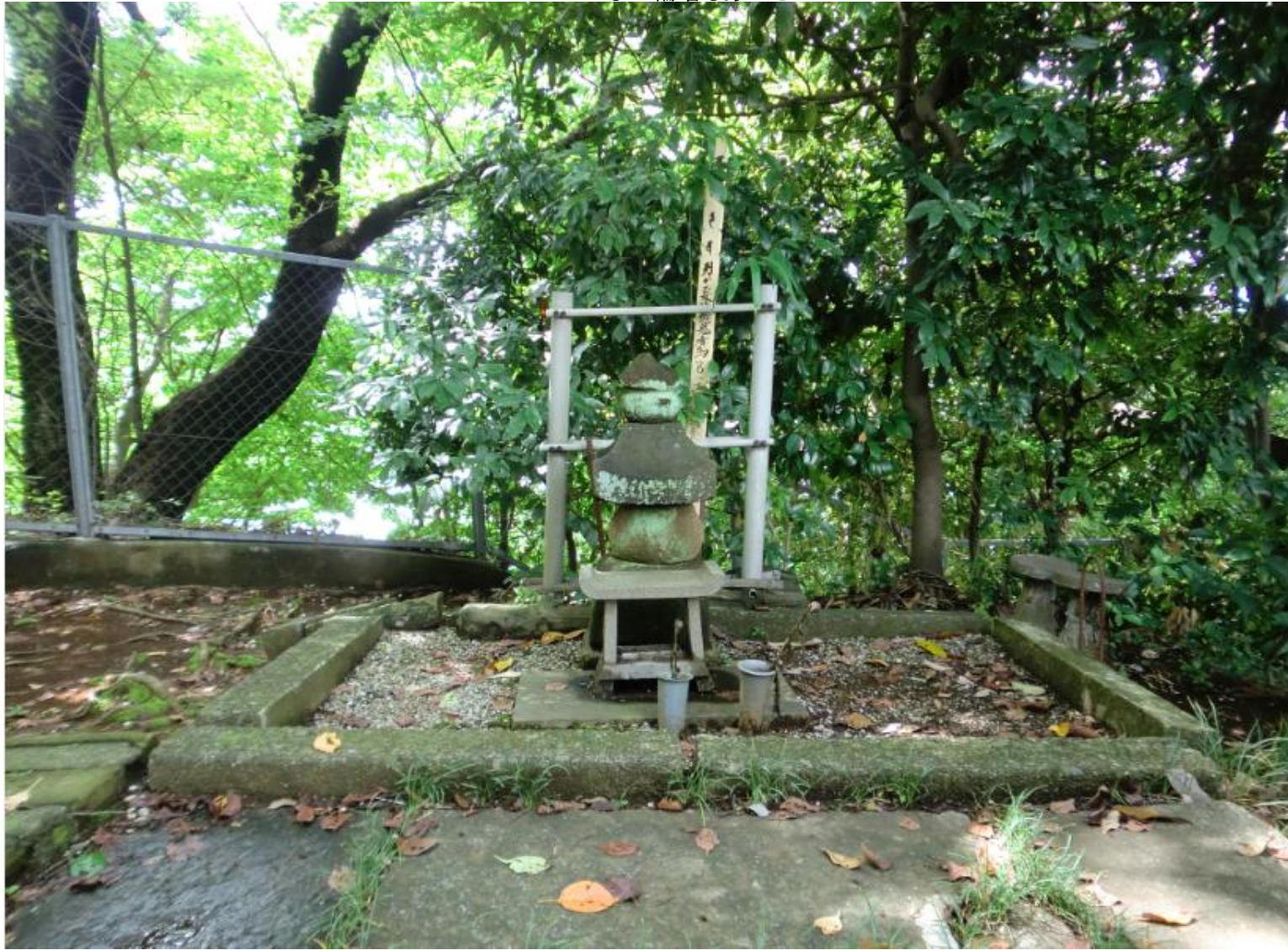
こんな五輪塔もあった