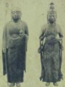
木造地藏菩薩立像 木造聖観世音菩薩立像

当寺は、真言宗豊山派に属し、慈覚大師(円仁)により、平安時代承和年間(八三四〜八四八)に創建されたと伝えられています。