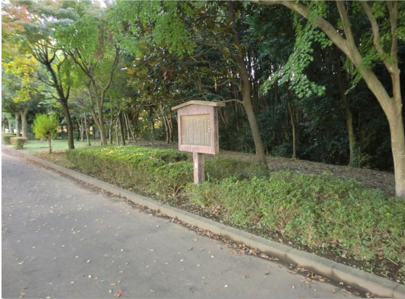
右手の雑木林が三ツ木城跡とされるエリア