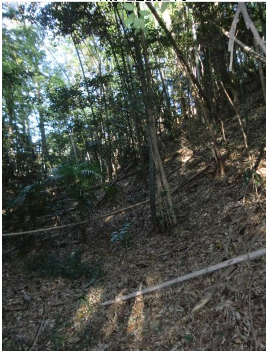
内側の土塁を見上げる