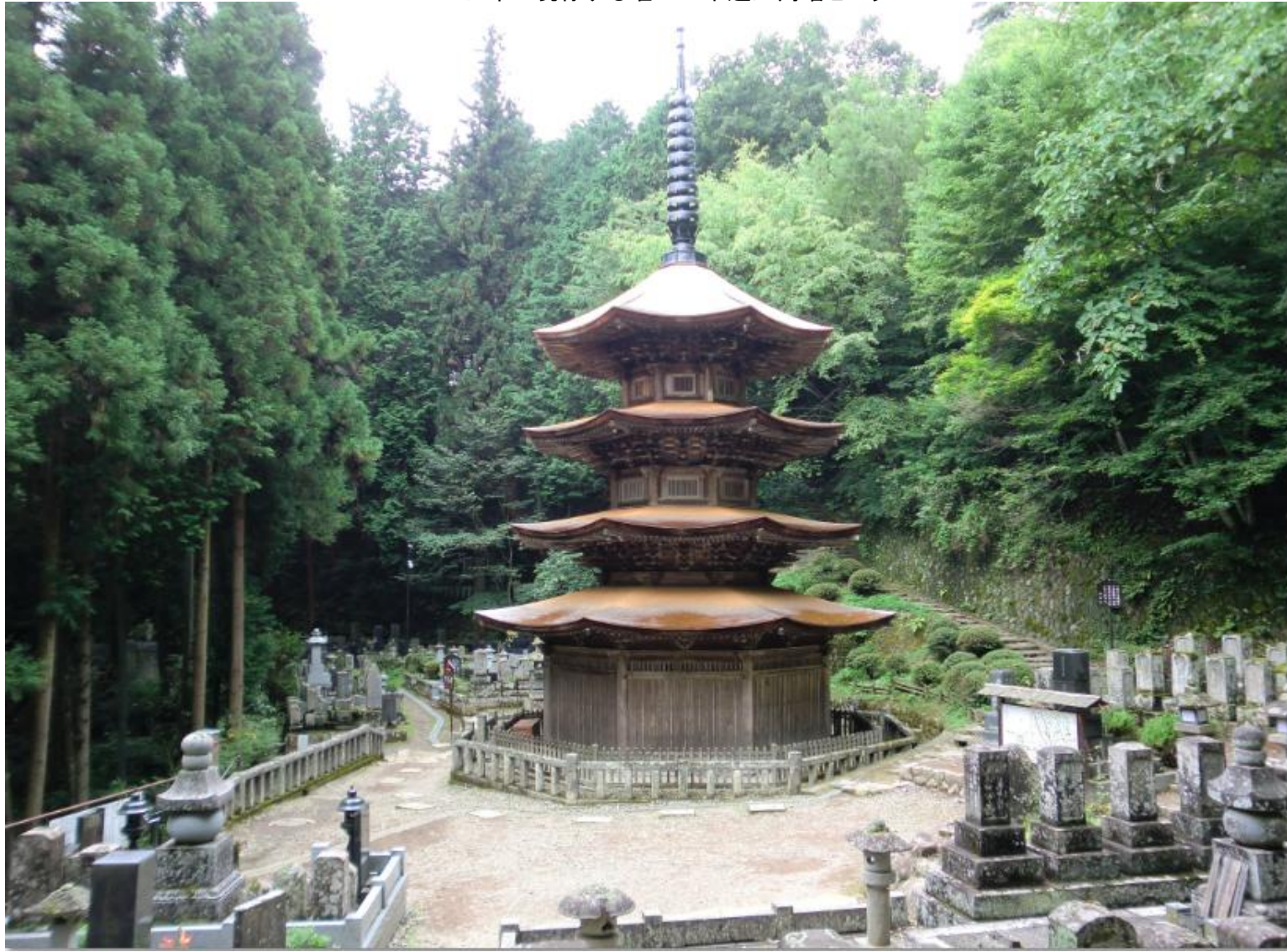
日本で現存する唯一の木造八角塔という