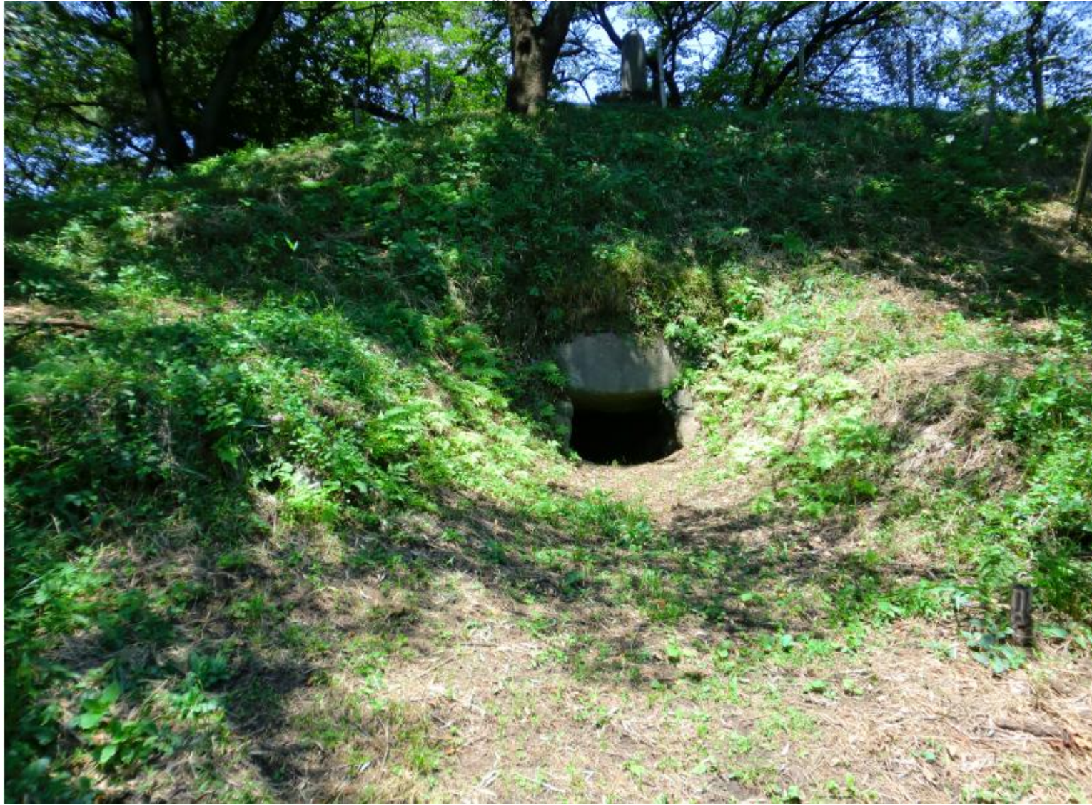
前方部の石室入口