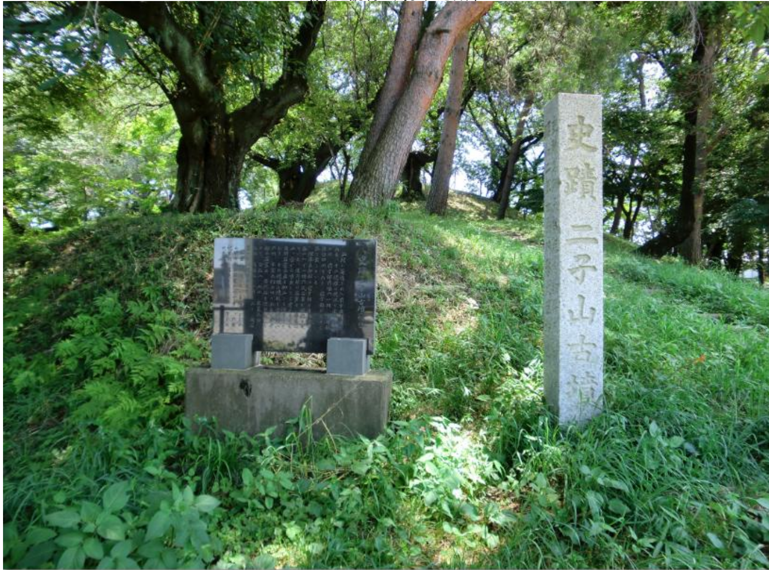
標柱と説明が刻まれた石碑