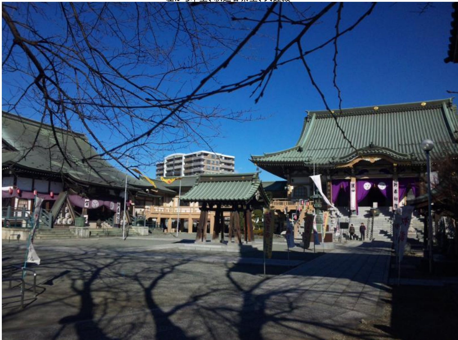
左から本堂、釈迦甘茶堂、大鐘殿