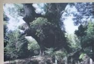
塚崎のクス (国指定天然記念物)