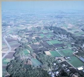
上空から見た塚崎古墳群

塚崎古墳群は、4世紀～5世紀頃に造られた古墳群です。現在見つかっているだけで円墳54基、前方後円墳5基、南九州独自の「お墓」地下式横穴墓の20基以上が存在します。 この古墳群には、日本最南端の前方後円墳があり、大隅地域最古の古墳群です。古墳時代には前方後円墳とつくるとは位の高い人でしかできなかった。そのため、塚崎古墳群は日本最南端の古墳文化の在り方を示す重要な史跡として、昭和20年2月22日に国指定史跡となりました。最近の調査では、壺形の埴輪や、初期須恵器とよばれる当時の最先端の遺物が出土しています。