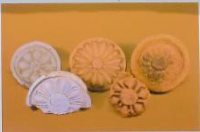
勝呂廃寺出土の軒丸瓦

飛鳥時代の終わりごろ(六八〇年ごろ)、この地に寺院が建てられました。発掘調査によって、寺院の建物に使われた瓦や鉄の釘、土器などがたくさん出土しました。また、五重塔などの先端につけた青銅製の相輪が発見されました。埼玉県内において最古の寺院のひとつです。建物の柱が建っていた部分にコンクリート柱を埋め建物の一部を示しています。