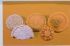
勝呂廃寺出土の軒丸瓦

飛鳥時代の終わりころ（六八〇年ころ）、この地に寺院が建てられました。発掘調査によって、寺院の建物に使われた瓦や鉄の釘、土器などがたくさん出土しました。また、五重塔などの先蹟につけた青銅製の相輪が発見されました。埼玉県内において最古の寺院のひとつです。建物の柱が建っていた部分にコンクリート柱を埋め込む物の一部を示しています。