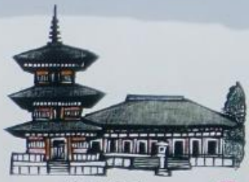
勝呂廃寺 (イメージは奈良の飛鳥寺)

飛鳥時代の終わりごろ(六八〇年ごろ)、この地に寺院が建てられました。発掘調査によって、寺院の建物に使われた瓦や鉄の釘、土器などがたくさん出土しました。また、五重塔などの先端につけた青銅製の相輪が発見されました。埼玉県内において最古の寺院のひとつです。建物の柱が建っていた部分にコンクリート柱を埋め建物の一部を示しています。