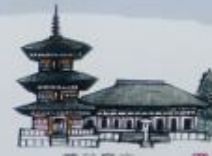
勝呂廃寺 (埼玉県指定重要文化財)

飛鳥時代の終わりころ（六八〇年ころ）、この地に寺院が建てられました。発掘調査によって、寺院の建物に使われた瓦や鉄の釘、土器などがたくさん出土しました。また、五重塔などの先蹟につけた青銅製の相輪が発見されました。埼玉県内において最古の寺院のひとつです。建物の柱が建っていた部分にコンクリート柱を埋め込む物の一部を示しています。