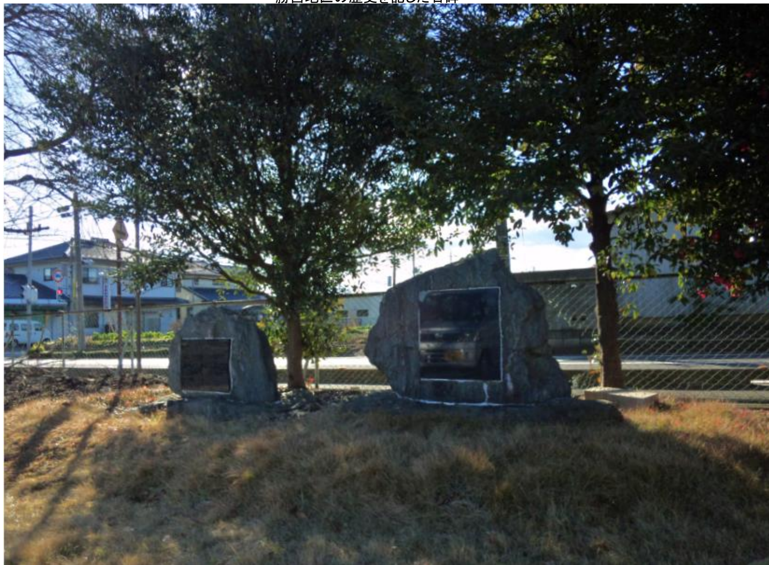
勝呂地区の歴史を記した石碑